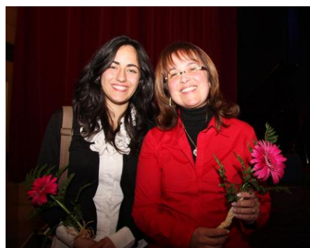
Lauréates du concours Karaokez en français 2012