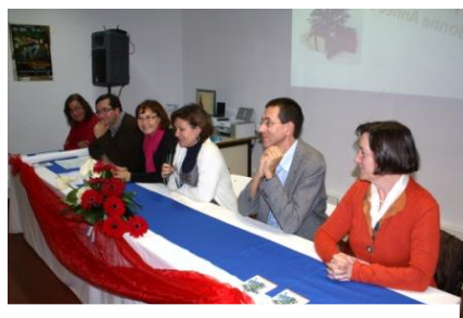
Cérémonie de remise des diplômes DELF aux élèves de l' Agrupamento Damião de Goes, à Alenquer