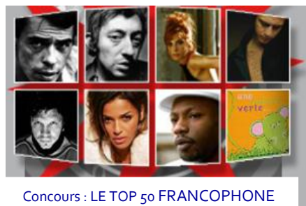
Concours : LE TOP 50 FRANCOPHONE